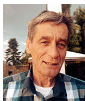
Arno Voorts Senioren / Jeugd