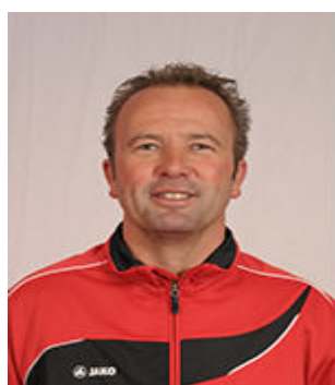
Patrick Franx Accomodatatie