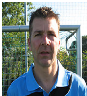
Frank de Hoog Clubhuis